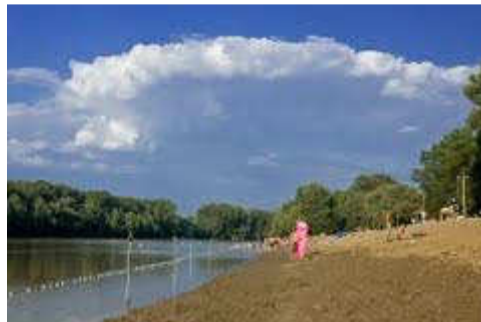
2. számú kép